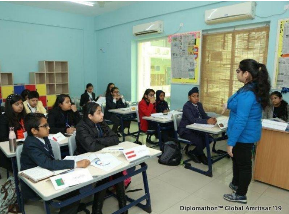
Diplomathon™ Global Amritsar '19